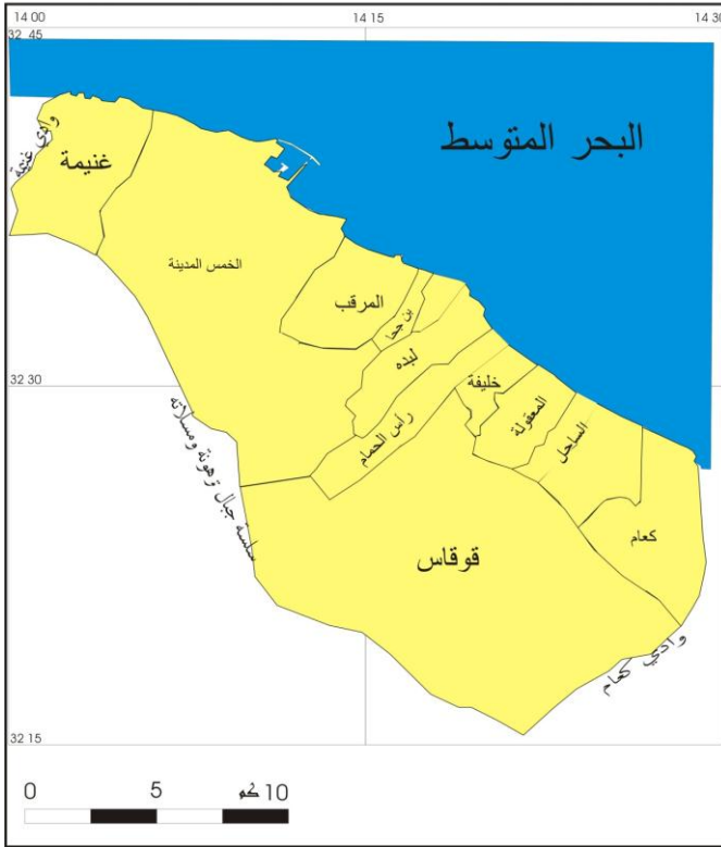
الشكل (١) الموقع الجغرافي والفلكي لمنطقة الخمس